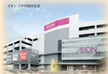
イオン 八千代緑が丘店

駅も近いし、小学校へも歩いてすぐ。大きな公園だって身近だし、毎日のお買物もラクラク。そんな恵まれた街と、ゆったり快適な住まいだから、家族みんなの「あれも、これも」がみんな叶います。