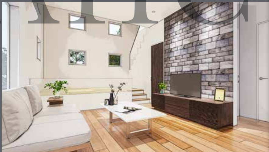
リビング横には小上がりの和室を設置。お子様の遊び場やリラックススペースとして最適です。