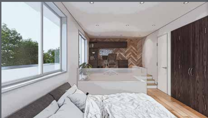
主寝室に設けたリーブルスペースは、デスクなどを設置してテレワークスペースとしても活用できます。