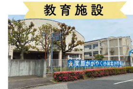
教育施設 印西市立小林北小学校 徒歩7分(500m)