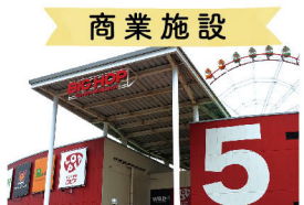
商業施設 BIGHOP 車12分(5,200m)