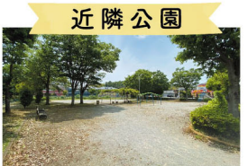
近隣公園 中丑西公園 徒歩1分(60m)