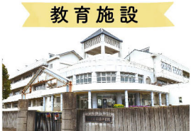
教育施設 印西市立小林中学校 徒歩20分(1,600m)