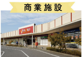
商業施設 牧の原モア 車10分(5,000m)