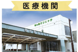
医療機関 牧の里クリニック 徒歩1分(30m)