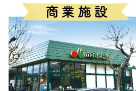
商業施設 マルエツ小林店 徒歩2分(90m)