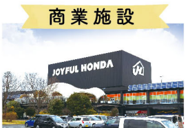
商業施設 ジョイフル本田 千葉ニュータウン店 車10分(5,000m)