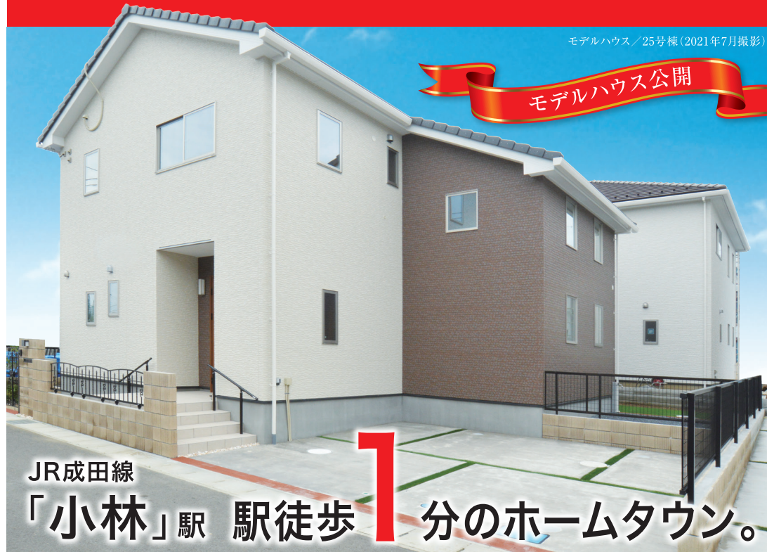
モデルハウス/25号棟(2021年7月撮影)