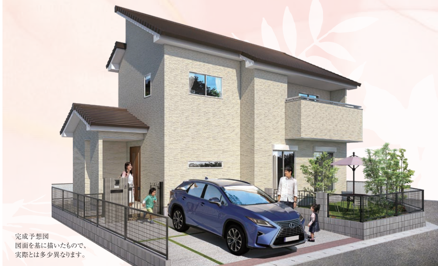
完成予想図 図面を基に描いたもので、 実際とは多少異なります。