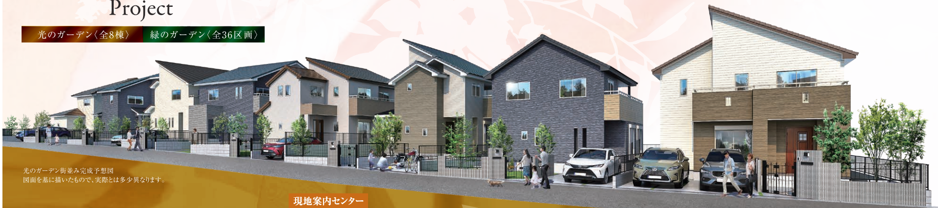
光のガーデン街並み完成予想図 図面を基に描いたもので、実際とは多少異なります。