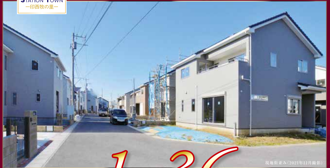
現地街並み(2021年11月撮影)