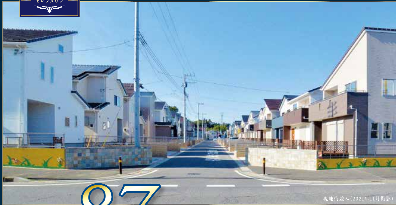
現地街並み(2021年11月撮影)