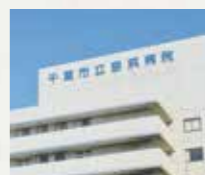
■千葉市立海浜病院 車5分(約2,400m)

■たかた眼科整形外科 徒歩12分(約900m) ■稲浜クリニック 徒歩7分(約550m) ■高浜デンタルクリニック 徒歩8分(約600m)