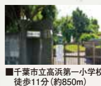
■千葉市立高浜第一小学校 徒歩11分(約850m)