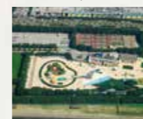
■稲毛海浜公園プール 徒歩10分(約800m)

シーサイドコート稲毛海岸の周りには緑豊かな公園や海がたくさん!放課後や休日はいっぱい遊ぼう!