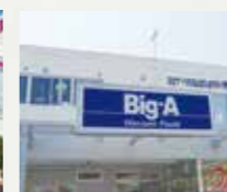
■ビッグ・エー千葉高浜店 徒歩12分(約950m)