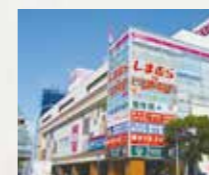
■イオンマリニア店 徒歩18分(約1,400m)