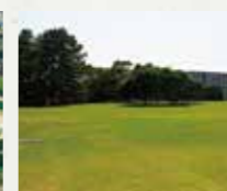
■高浜公園 徒歩7分(約550m)