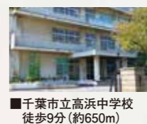
■千葉市立高浜中学校 徒歩9分(約650m)