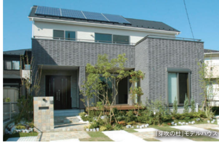
「芽吹の杜」モデルハウス