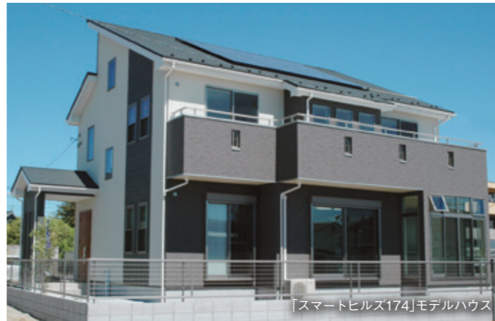
「スマートヒルズ174」モデルハウス